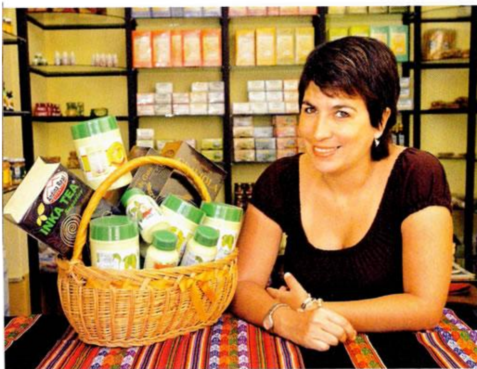
Empezó vendiendo maca. Está en lista de las más poderosas junto a Condoleezza Rice.

"La maestría que curso me ha permitido realizar una gestión más eficaz de mis empresas, aplicando los conocimientos adquiridos: he conse-